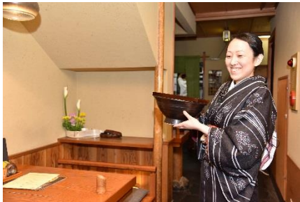
株式会社カトープレジャーグループ (大阪市内 各店舗)