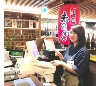
株式会社千隆 (大阪市内 各店舗)

今回の説明会では、お馴染みのフードサービス企業が登場！ 素敵な笑顔のシニアの方々が活躍しているお店で新しいお仕事を始めてみませんか？ ※勤務地や職種は、説明会の際に担当者にご相談ください。