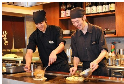
株式会社大阪フード (大阪府内 各店舗)